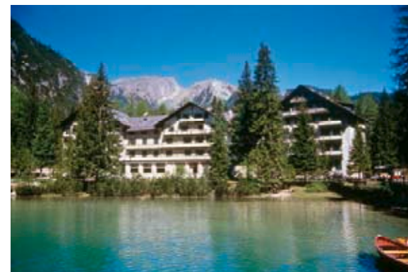
Der Tagungsort: Das Hotel „Pragser Wildsee“.

1939 mussten die deutsch- und ladinischsprachigen Südtirolerinnen und Südtiroler sich für die Abwanderung ins Deutsche Reich oder den Verbleib im Königreich Italien entscheiden. 70 Jahre danach ist dies ein Anlass, um kritisch auf einen der einschneidendsten Momente der jüngeren Südtiroler Geschichte zurückzublicken.